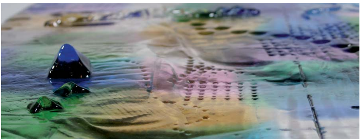
▲ Abb.3 Objekt nach der Behandlung mit Splitterschutzlack.